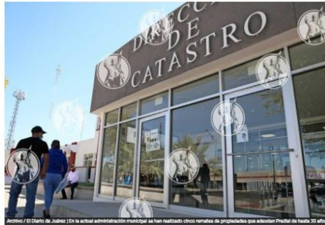
En la actual administración municipal se han realizado cinco remates de propiedades que adeudan Predial de hasta 30 años